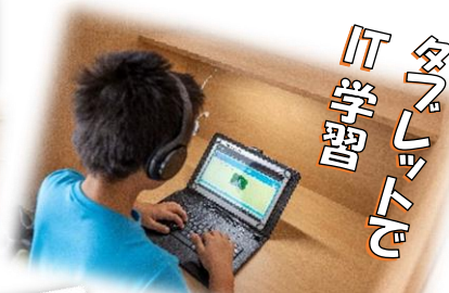
タブレットでIT学習