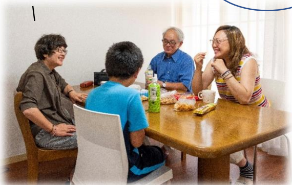
ランチルームでくつろぐ子どもとスタッフ